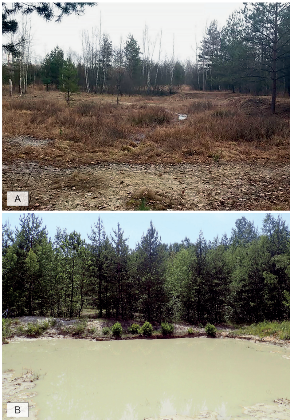
Obr. 2 – Lokalita Jíloviště v roce 2016 (A) a v roce 2018 (B). Fig. 2 – Locality Jíloviště in 2016 (A) and in 2018 (B).