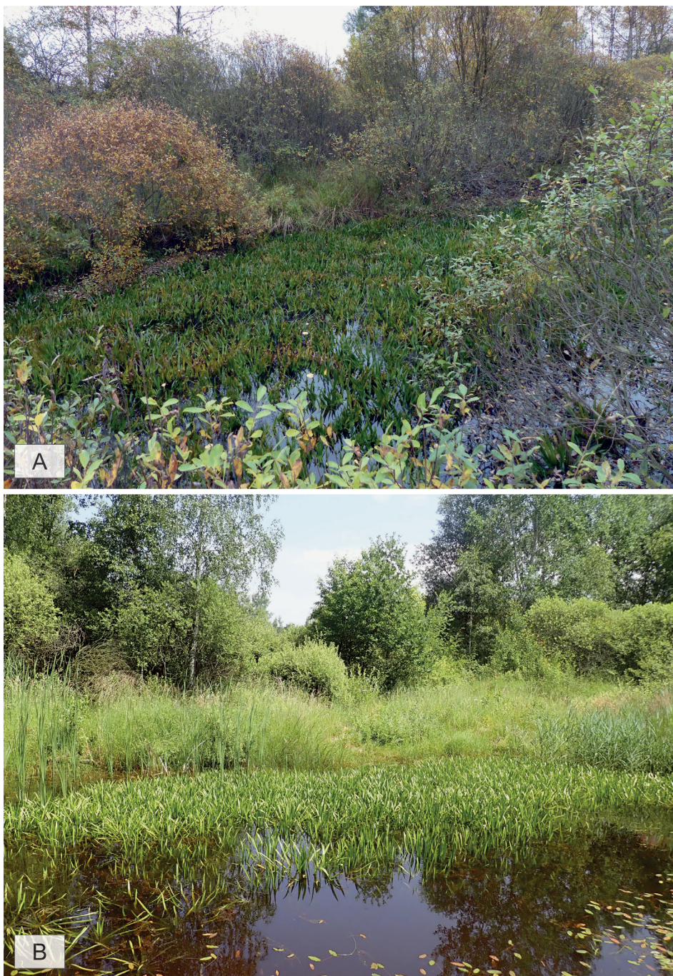
Obr. 1 – Lokalita Řezanová tůň v roce 2016 (A) a v roce 2018 (B) (foto T. Maxerová & V. Kolář). Fig. 1 – Locality Řezanová tůň in 2016 (A) and in 2018 (B) (photo by T. Maxerová & V. Kolář).