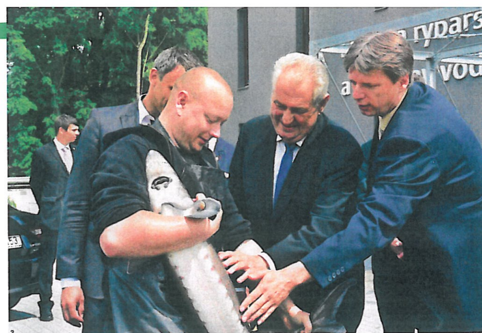
▲ POHLADIL SI JESETERA. Školu navštívil i prezident republiky Miloš Zeman. Ocenil zdejší pedagogy a vědecké úspěchy.

Děkanem Fakulty rybníkářství a ochrany vod Jihočeské univerzity v Českých Budějovicích je již od jejího založení v roce 2009. Letos v říjnu mu končí druhý mandát, funkci již nemůže obhajovat. Vystudoval Vysokou školu zemědělskou v Brně, specializace rybníkářství. V roce 2006 byl jmenován profesorem v oboru zootechnika. Působil v zahraničí, například ve Francii či Singapuru. Ve významné vědecké databázi Web of Science má zařazeny již takřka dvě stovky publikací. Je ženatý, má tři děti a jedno vnuče.